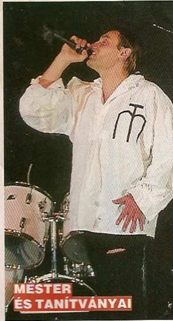
MÉSTER ÉS TANÍTVÁNYAI

Amikor a homlok, meg a tarkó összeér, Minden fodrász rólunk álmodik. De hidd el, ez már más világ, S megérted majd azt is, ami most Himalájául van. R.: Tegnap megint hígat főztél, És senki nem kér már. Telkünk végén ledugja az ujját, A kis kertkaput öleli át.