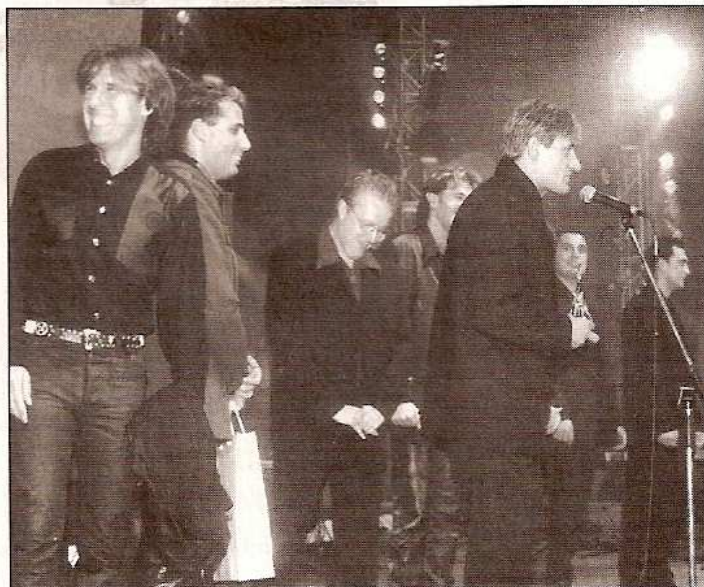
Ákos – 2000 – „Bestof” Az év hazai rock albuma