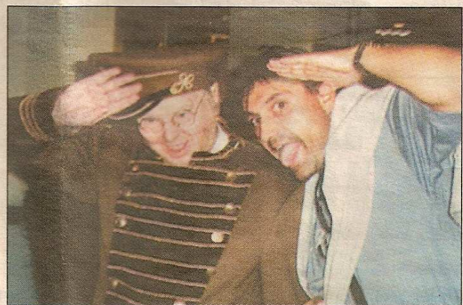
A vidám „mirigyek”.