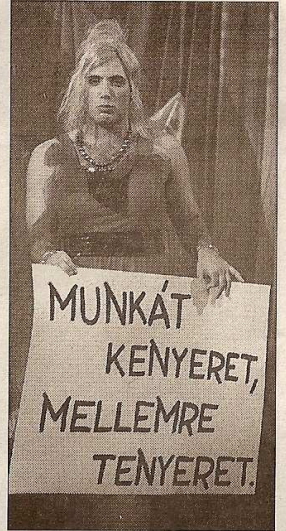
Varga Győző a női jogokért harcol a dobogón